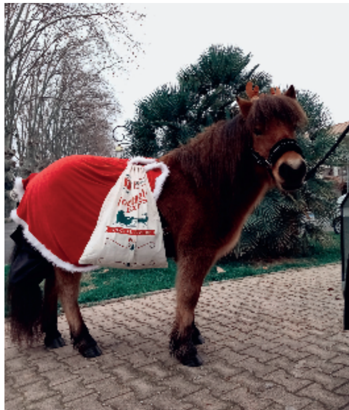
Meilleurs vœux des poneys visiteurs !