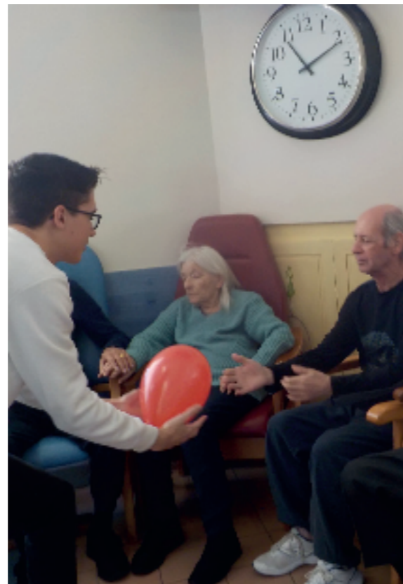
Echange de balle !