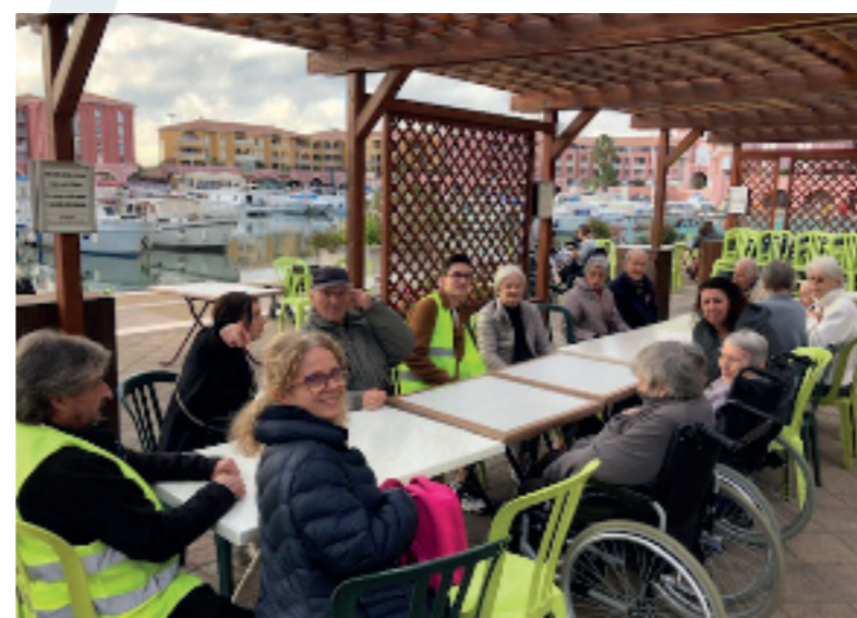
Un petit air marin qui nous chatouille les narines

Vos représentants du conseil de la vie sociale