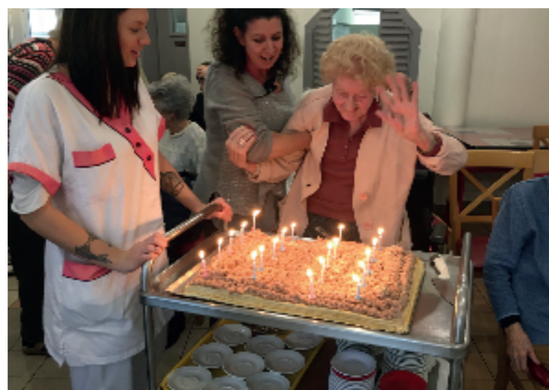
Un petit salut de la main aux années écoulées !