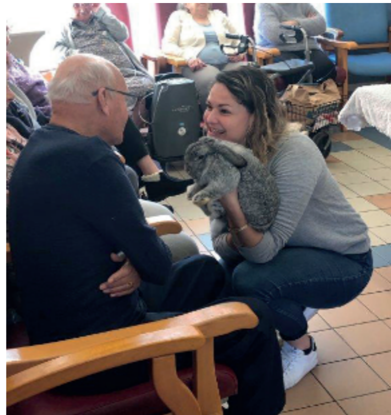
De la douceur, rien que de la douceur !