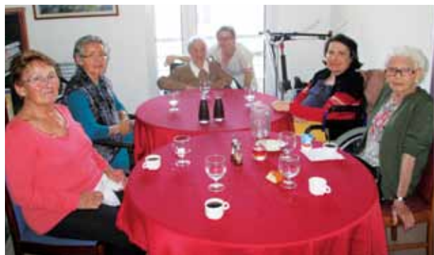
Un repas thérapeutique très convivial !