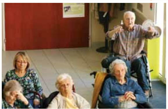
Voici notre résident qui bat la mesure...un vrai bonheur pour lui !