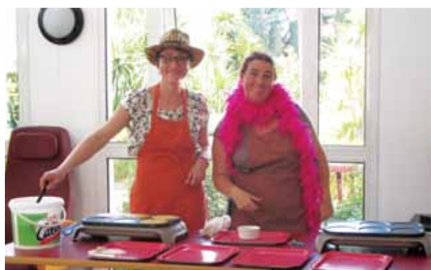
Un après-midi crêpes apprécié de tous.