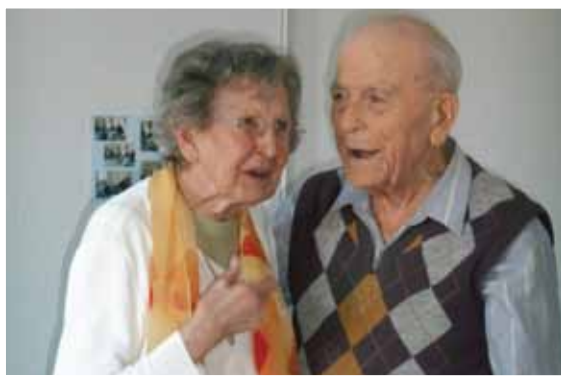
Une belle amitié pleine de complicité entre ces deux-là...