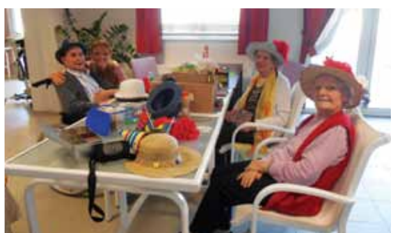
Confection de chapeaux !