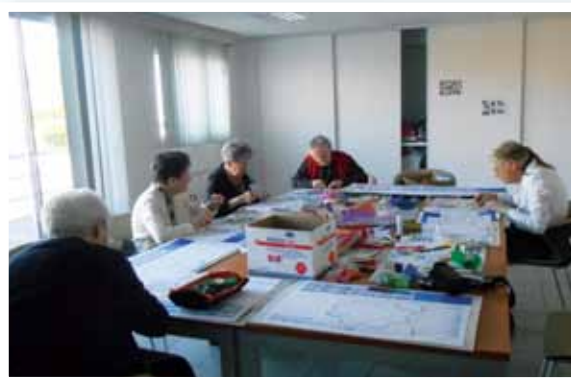
En pleine concentration pour réaliser des décors.