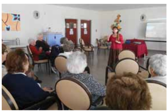
Une conteuse à La Martégale et chacun voyage dans son univers.