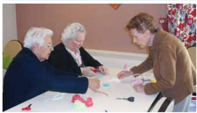
Voilà, on s'adonne au bricolage et on s'applique...