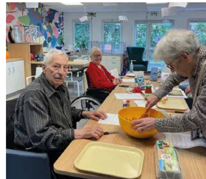
Repas convivial du vendredi