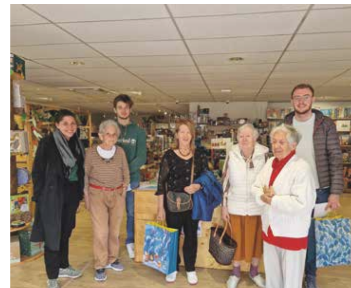
Achat de nouveaux jeux à la Baraka Jeux

Nos résidents apprécient beaucoup et toujours la visite de nos élèves en formation animation. Une belle rencontre s'est déroulée le lundi 15 mai. Des ateliers variés et stimulants ont été proposés.