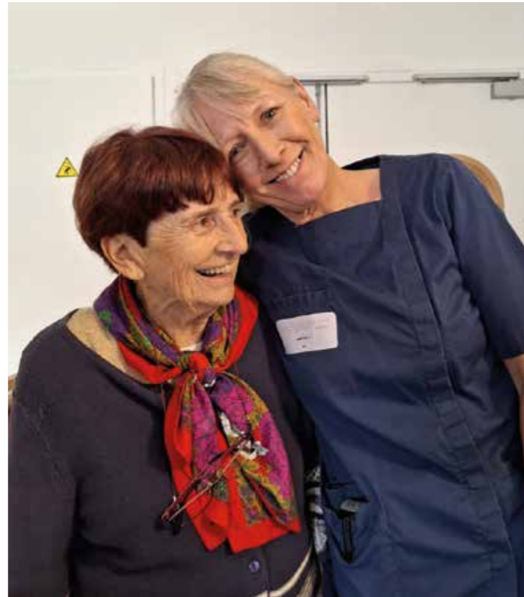
Un beau moment de partage à la Gloriette