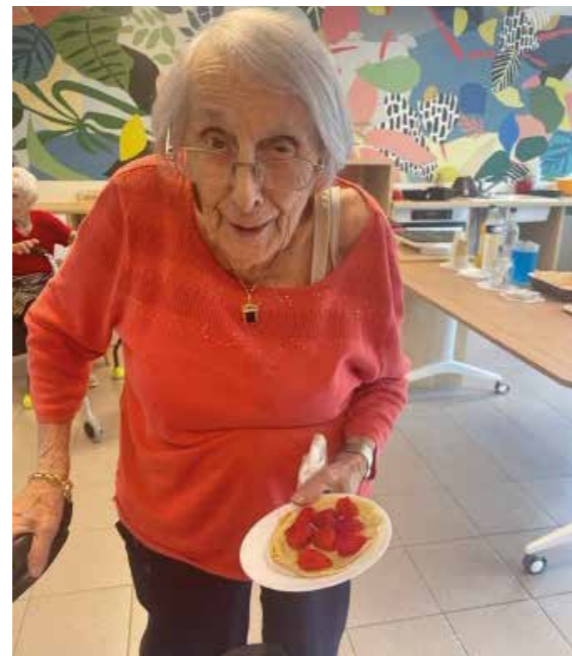
Goûter sucré salé du samedi après-midi