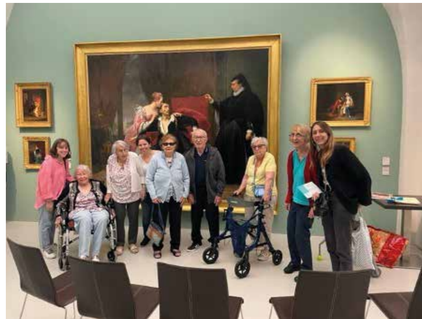
Visite du musée Fabre « La mort de Charles IX »