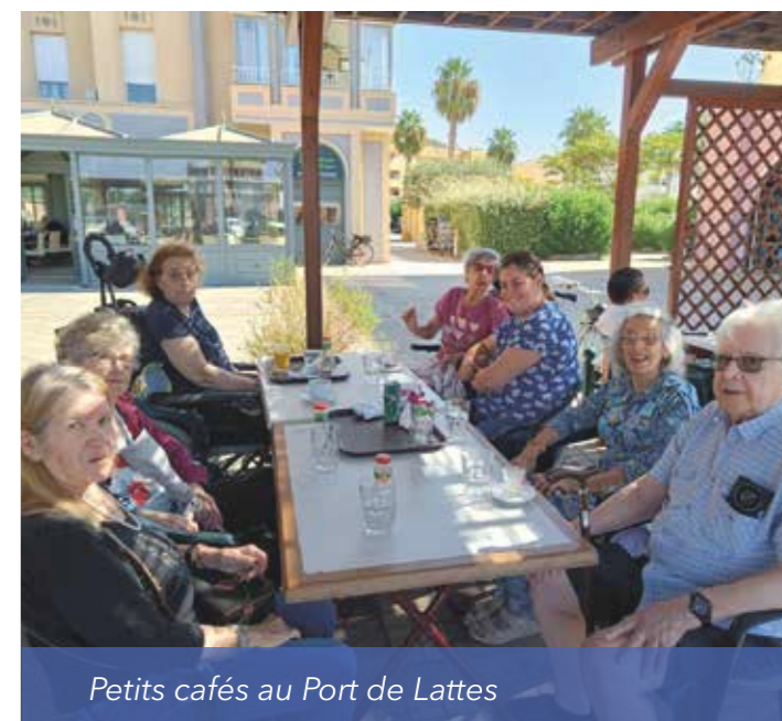
Petits cafés au Port de Lattes

CM1 ; un rendez-vous hebdomadaire, tous les jeudis après-midi, durant toute l'année scolaire 2023/2024 !