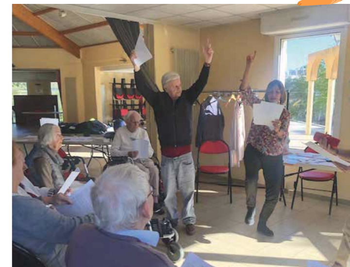
Animation haut parleur